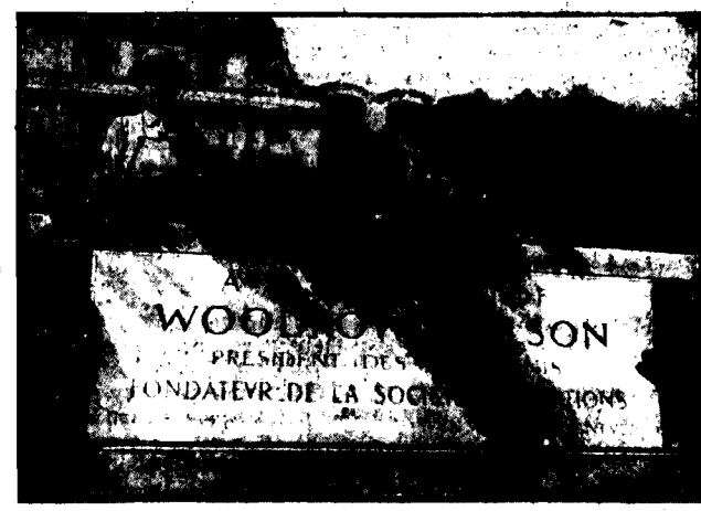
Wdowa po wielkim prezydencie Stanów Zjednoczonych, Wilsonie, ozdabia kwiatami tablicę, ku czci jego ufundowaną w Genewie.