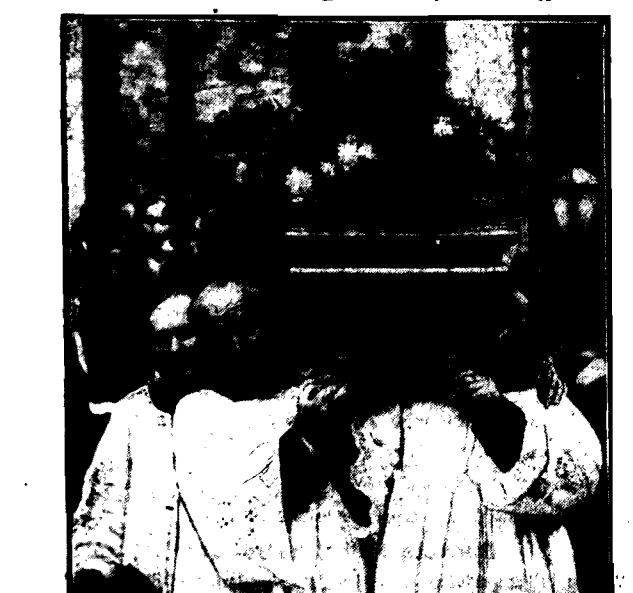
Pogrzeb warszawskiego biskupa-sufragana