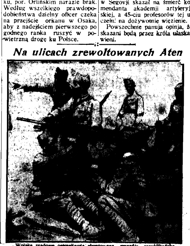
Wolność czadone nakreślenie zbuntowana gwardia republikańska.