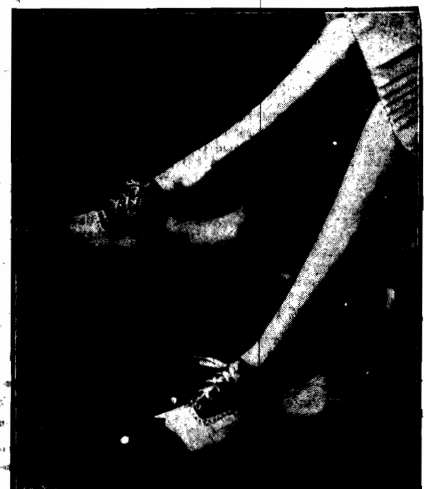
Wzór eleganckich pantofelek sportowych w stylu amerykańskim